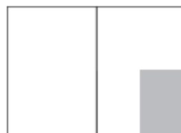
1/4-side (kvart) 102 x 146 mm