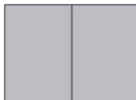
2/1-side (opslag) 420 x 297 mm