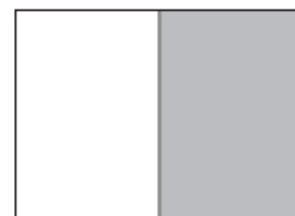
1/1-side (helside) 210 x 297 mm